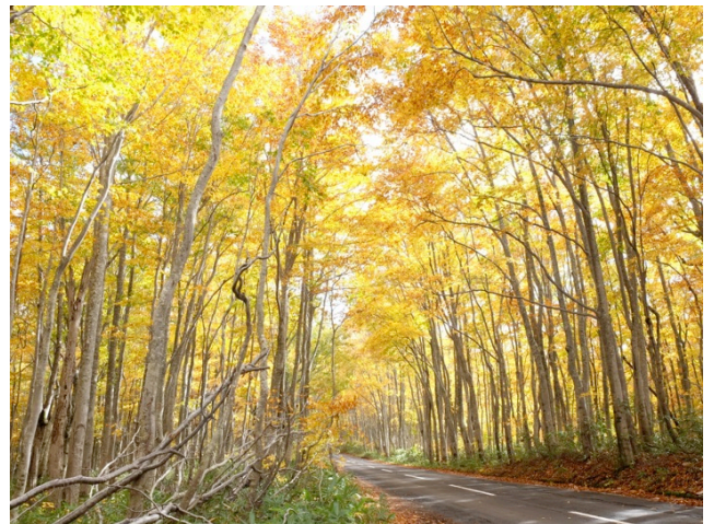
写真 2 : 10 月中頃の八甲田山の調査地にて

タスやゴーヤなどの園芸作物、さらには土壤微生物など多岐にわたり、学生ひとりひとりが自分のテーマを持ち、研究を進めている。学部 3 年の 4 月から配属になるため、学部生は卒業までの丸 2 年間で研究に費やせるというのは特徴的な点である。今の時期は、3 年生はテーマ選択に、4 年生は卒業研究の完成に向かってせわしなくゼミ室を出入りしており、私も鼓舞される毎日である。調査では八甲田山や白神山、大学近隣の里山など青森の豊かな自然を主なフィールドに、野外の生態現象の解明に取り組んでいる。特に、秋の八甲田山は、広大なブナ林が黄金色に美しく紅葉し、私の好きな景色のひとつである(写真2)。さらに、大学構内には圃場の畑や温室、室内の栽培部屋があり、これらを利用した栽培・飼育実験によって野外でみられた現象について、さらなる正確な検証を行っている。