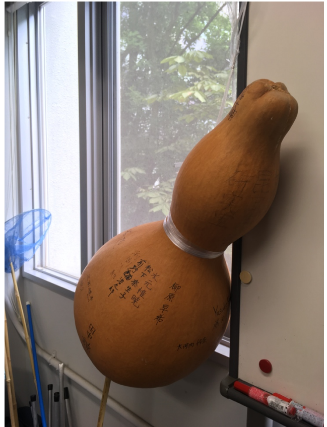
図 4. 大ひょうたん。OB・OG の名が残される。