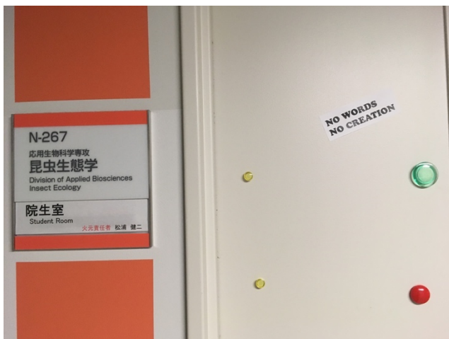
図 1. 院生室の入口ドアに貼られた “NO WORDS, NO CREATION” のステッカー。

研究室のあるエリアに来た人はすぐに、この標語が書かれたドアのステッカーが目に留まるだろう (図 1)。京都大学大学院農学研究科 昆虫生態学研究室。私がこの研究室に助教として着任してから、今年 (2018 年) で 5 年目となった。生態学分野の著名な研究者を多く輩出してきた老舗研究室であり、新参者の私が研究室紹介をするというもおこがましく思われるのだが、最近の動向を周知するのも現役メンバーの務めと思い直し、筆を執らせていただく。過去との比較の観点が欠落していることについては、どうかご容赦願いたい。