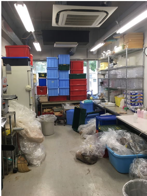
図 2. 解体部屋の内部。5月には営巣材であふれる。

もしあなたがヤマトシロアリを研究材料に選んだ場合、年度始めからうかうかしてはいられない。結婚飛行の時期がちょうどゴールデンウィークと重なるのだ。研究室が一番慌ただしくなるのがこの時期である。毎日のように山に向き、木こりのごとく道なき斜面をゆき、重い営巣木を持ち帰っては、「解体部屋」と呼ばれる一室（ 図 2 ）で夜を徹してシロアリを取り出す。