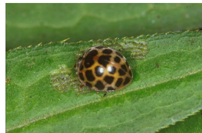
ヤマトアザミテントウの成虫

ヤマトアザミテントウは年 1 化性の植食性テントウムシで、調査地では成虫・幼虫ともにカガノアザミだけを食草にしているスペシャリスト昆虫である。春先に越冬から覚めたメス成虫はアザミの葉裏に卵塊を産み付ける。孵化した幼虫は同じ株の葉を摂食し、初夏に成虫になるが、繁殖はせずにその後アザミの根際近くの落葉や土の下で越冬に入る。